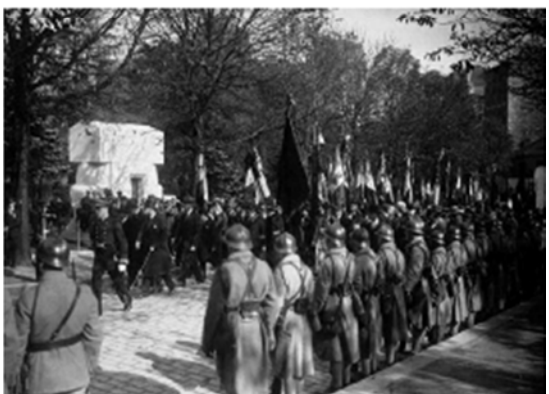
Inauguration du monument élevé à la mémoire des soldats belges au Pire-Ludovic Affix des drapeaux belges et français devant le monument