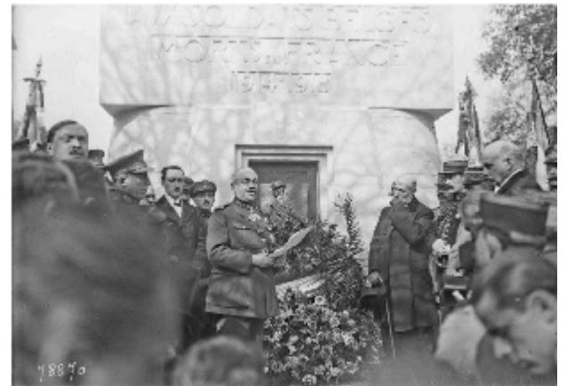
Discours du général COSTENS