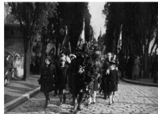
Ancien combattant belge portant la gerbe de l'archevêque