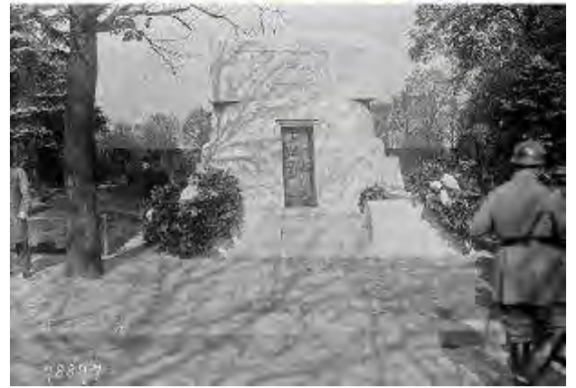
Comptes des soldats belges au front de la Marne-Lorraine à Paris, 1921. Coupes non marquées de la collection du Centre d'études de la guerre (n°s 720 à 724).