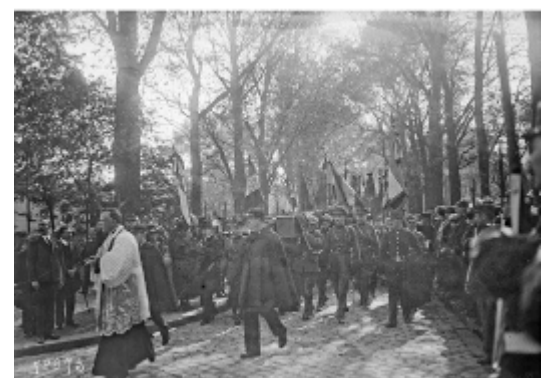
Information d'un soldat inconnu belge