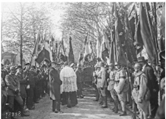
Les drapeaux entourent le drapeau national le corps du soldat inconnu belge