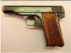
arme de 1946 avec des plaquettes en bois à la manière Allemande.

Les armes sont délivrées avec l'anneau de dragonne.