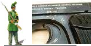
poinçon PH en gros plan.