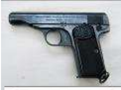
arme personnelle d'un officier modifiée à la MAE par la mise en place d'un pontet et d'un anneau de dragonne.