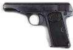
arme de la commande effectuée par la gendarmerie en 1938 pour l'armement des gendarmes supplétifs, elles portent le poinçon PH comme les armes militaires de l'époque.

Les armes sont délivrées avec l'anneau de dragonne.