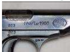
marquage de la Force aérienne sur le côté droit de la glissière.