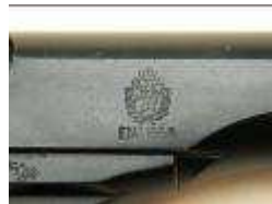
marquage ETAT 1958.