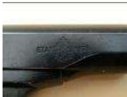
marquage ETAT 1959.