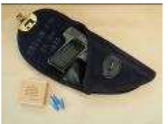
pistolet reconditionné en couleur grise, travail réalisé par l'arsenal de ROCOURT dans les années 60, l'arme est accompagnée d'un étui en web de la gendarmerie et d'une boîte de cartouches de tir réduit destinée à l'entraînement.

les six armes examinées dans cet article.