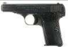
arme de la commande de la FAé, vue gauche.